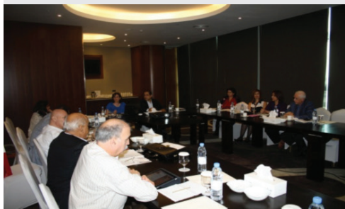
جانب من اجتماعات اللجان المختلفة قبيل اجتماع مجلس الأمناء - دبي